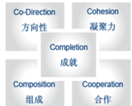
IWNC 5C 团队效能测评